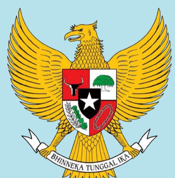
EMBASSY OF THE REPUBLIC OF INDONESIA HANOI