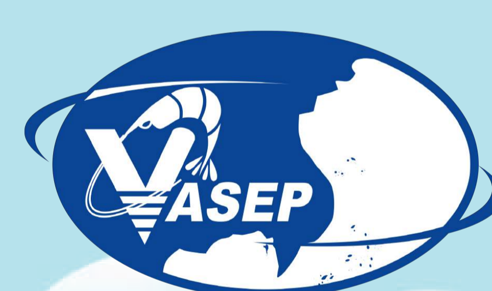
Hiệp hội Chế biến và Xuất khẩu thủy sản Việt Nam (VASEP)