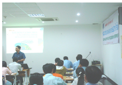
Nghe giảng – xem film