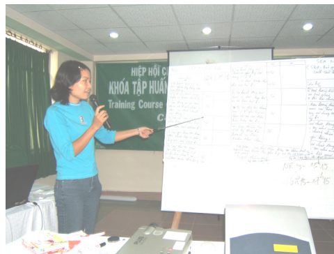
Học viên thuyết trình bài tập nhóm