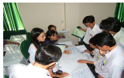
Cùng nhau trao đổi – thảo luận