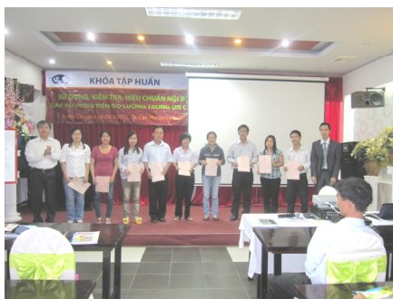
Nhận Giấy khen – Chứng chỉ sau khóa học