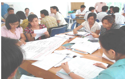
Làm bài tập nhóm