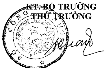
Lê Dương Quang

b) Giá bán lẻ cho các khách hàng sử dụng điện trong các khu công nghiệp mua điện từ lưới điện quốc gia đồng thời có nguồn phát điện tại chỗ được quy định tại Điều 13 của Thông tư này. /.