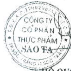
HỒ QUỐC LỰC